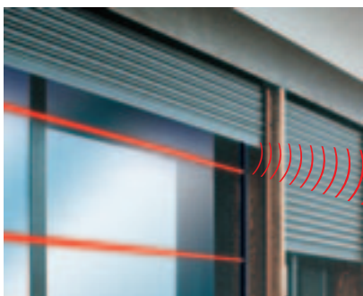
1 BARRIERE A RAGGI INFRAROSSI