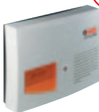
3 SIRENA ESTERNA CON LAMPEGG